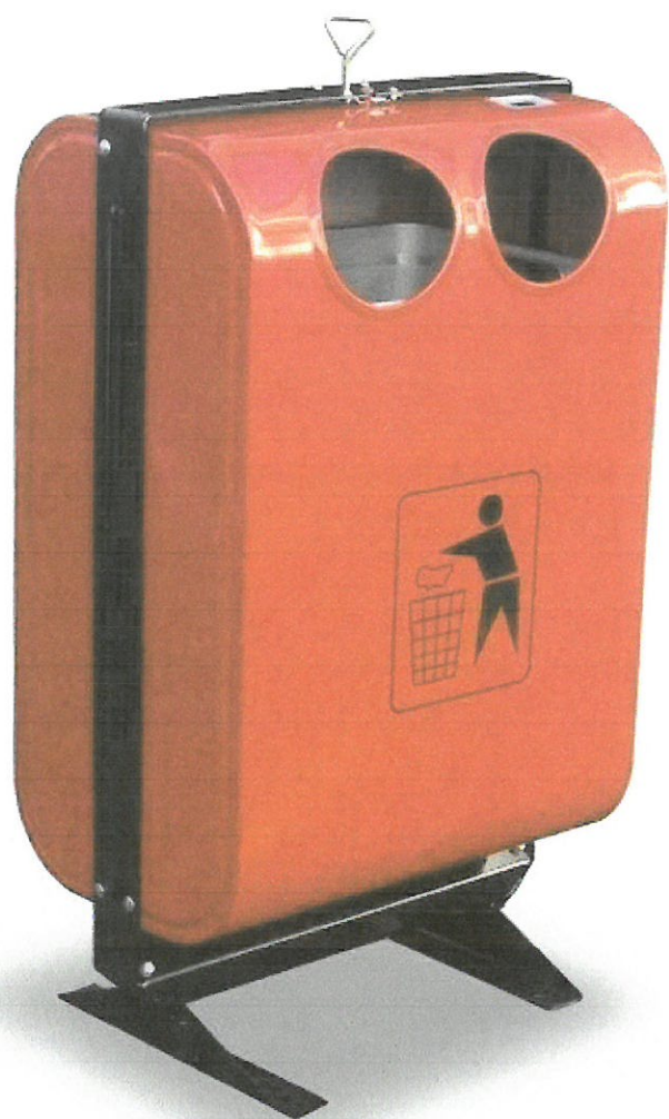
Przykładowy śmietnik typu "foka"